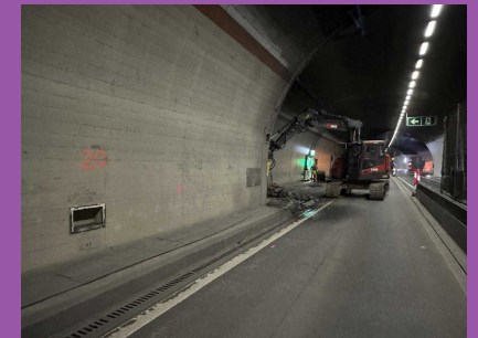
Abbruch Bankett Nord